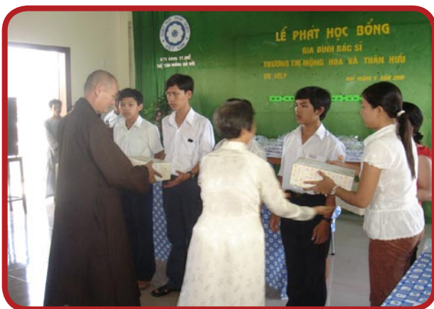
Students in Thua Thien Hue receiving scholarships, 8/2008