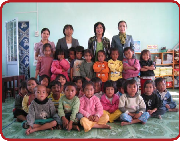
Kindergarteners in Kontum, 2011

M icrofinance Program (34,000 USD) provided small loans to 165 women in the Hoa Hop village, Tam Duong district, and Vinh Phuc province to help them escape poverty and improve the role of women in the family. VNHELP values the Elmbrook Rotary Club for their 5-year commitment to provide funding for this program.