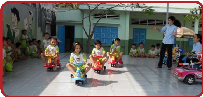
Tân Thiên Kindergarten in Nha Trang, 2011

A year has gone by rapidly. Christmas is here and the New Year is coming. During this Holiday Season, VNHELP is imploring you to give a charitable gift to the poor people in Vietnam. We achieved many excellent results in 2011 with a total expenditure of about 550,000 USD (five hundred fifty thousand dollars) to help many thousands of poor people. VNHELP would like to express our sincere thanks to all donors who contributed financially, from seniors who contributed 20 USD to companies who contributed hundreds of thousands of dollars. We greatly appreciate the timeless contribution of many dedicated volunteers in both Vietnam and the U.S. We wish to continue receiving your support to create more profound impacts in 2012.