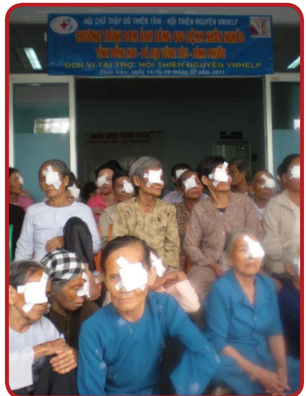
Cataract patients in Bà Rịa Vũng Tàu, 02/2011