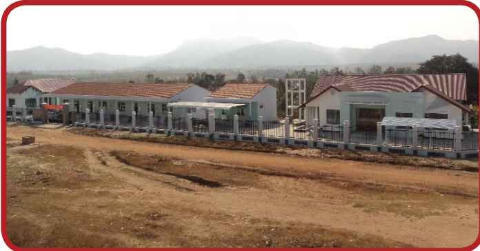
Họa My Kindergarten in Kontum, 2011

Thấm thoát một năm lại trôi qua, lại đến mùa Giáng Sinh và năm mới 2012. VNHELP xin kêu gọi quý vị dành một món quà từ thiện trong mùa lễ này cho những người nghèo tại Việt Nam. Hội VNHELP đã đạt được nhiều thành quả tốt đẹp trong năm 2011 với tổng số tiền chi trực tiếp cho các dự án nhân đạo vào khoảng 550.000 $US (năm trăm năm mươi ngàn đô la), giúp đỡ hàng trăm ngàn người nghèo. VNHELP chân thành cảm tạ tất cả các thiện nguyện viên và các nhà hảo tâm đã đóng góp tài chính, từ những vị cao niên đóng góp 20 $US đến các công ty đóng góp hàng trăm ngàn đô la. Chúng tôi ước mong được tiếp tục nhận sự hỗ trợ của quý vị để thực hiện thêm nhiều dự án công ích hơn nữa trong năm 2012.